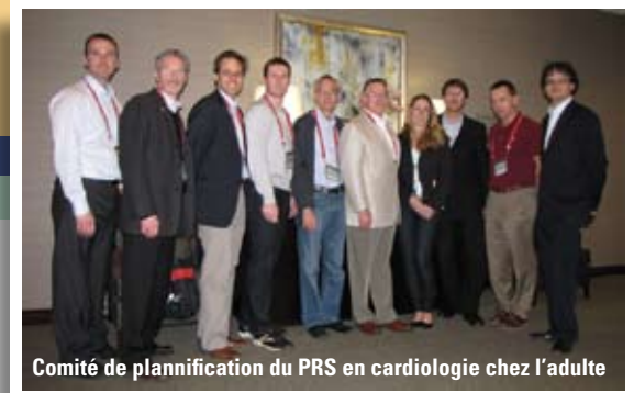
Comité de planification du PRS en cardiologie chez l'adulte

Les dons offerts par les individus et les organismes assurent le financement nécessaire pour concevoir de nouveaux programmes et pour développer les programmes existants de l'ASCC.