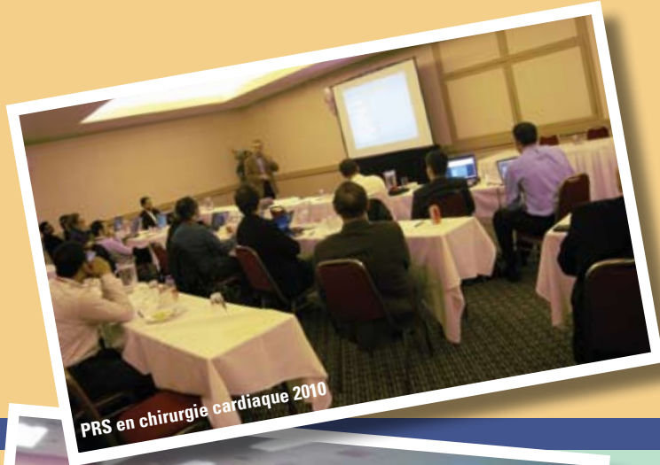
PRS en chirurgie cardiaque 2010

Le programme de bourse Ayez du cœur est une bourse de voyage qui permet à de jeunes étudiants en médecine, à des stagiaires de 3 e cycle et à des chercheurs en formation de se familiariser avec le domaine cardiovasculaire au Canada. Cette bourse finance annuellement 20 étudiants à participer au Congrès canadien sur la santé cardiovasculaire et leur permet de rencontrer les chefs de file de la communauté cardiovasculaire.