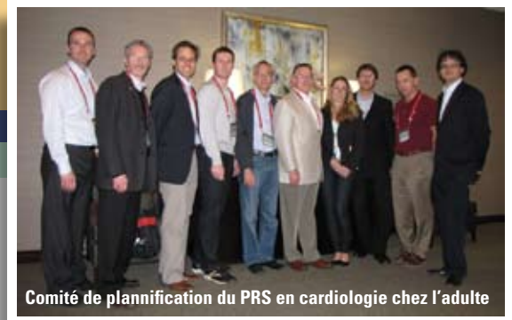
Comité de planification du PRS en cardiologie chez l'adulte

Les dons offerts par les individus et les organismes assurent le financement nécessaire pour concevoir de nouveaux programmes et pour développer les programmes existants de l'ASCC.