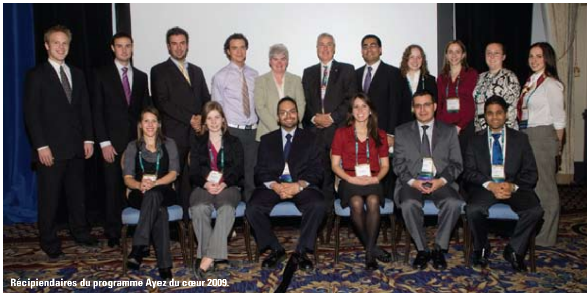
Réceptiendaires du programme Ayez du cœur 2009.

Faites en sorte que l'ASCC soit dans vos projets de dons! Apprenez en plus sur les façons de donner à l'ASCC au : www.ccs.ca/ccsa