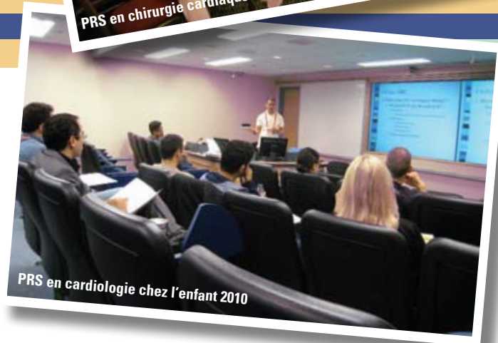
PRS en cardiologie chez l'enfant 2010