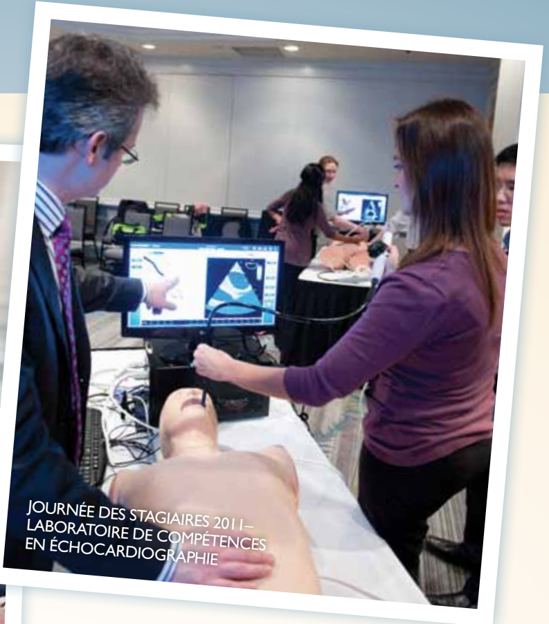
JOURNÉE DES STAGIAIRES 2011 - LABORATOIRE DE COMPÉTENCES EN ÉCHOCARDIOGRAPHIE

« La Journée des stagiaires a beaucoup évolué au cours des dernières années afin de répondre pleinement à l'ampleur des besoins et styles d'apprentissage des stagiaires canadiens et canadiennes. Faire partie de ce processus et observer mes boursiers stagiaires réagir au nouveau format a été vraiment encourageant. »